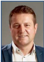
Ihr Alexander Scholl Bürgermeister Lampertheim